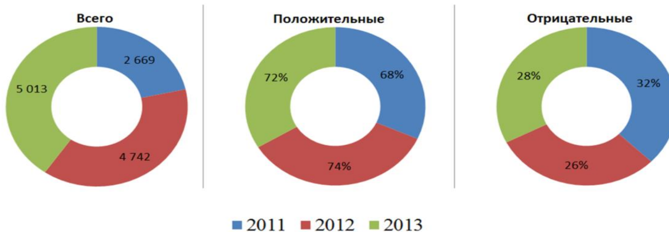
Соотношение положительных и отрицательных экспертиз в пяти СРОО в 2011-2013 гг.